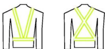
OD 1a Šle