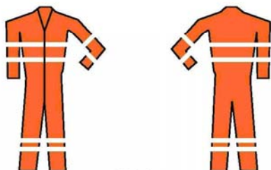
OD 1c Oblečení