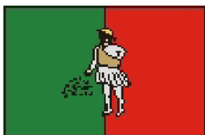
Vlajka městské části Milostovice