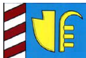
Vlajka městské části Zlatníky