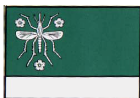
Vlajka městské části Komárov