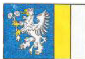
Vlajka městské části Podvihov a Komárovské Chaloupky