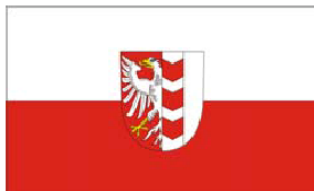
Vlajka Statutárního města Opavy

Grafická vyobrazení praporu Statutárního města Opavy a praporů městských částí