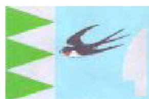
Vlajka městské části Vlašтовиčky